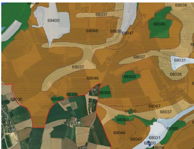
Ausschnitt digitaler Bodenkarte, Bodenformen

Die Marktgemeinde Thalheim bei Wels erarbeitete gemeinsam mit den Auftragnehmern und einer Steuerungsgruppe der OÖ LRG konkrete Ziele und Maßnahmen im Hinblick auf die erstmalige Implementierung des Bodenschutzes in der örtlichen Raumplanung.