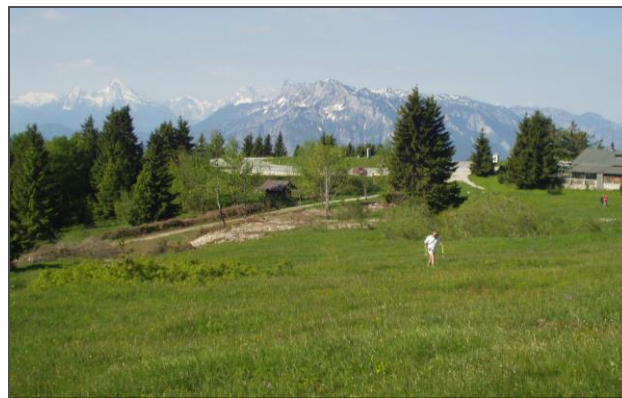
Gaisberg: Blick auf Watzmann und Untersberg