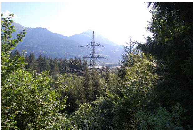
Vorhandene Leitung in Weidenburg

Die Erfassung und Bewertung umweltrelevanter Projektwirkungen wurde anhand einer modifizierten „Ökologischen Risikoanalyse“ durchgeführt. Die Methode ermöglicht die nachvollziehbare Abscheidung unerheblicher Auswirkungen und die vergleichende Gegenüberstellung unterschiedlicher Auswirkungen.