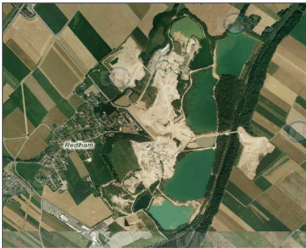
Orthophoto des Planungsgebietes

Seit Jahrzehnten wird am gegenständlichen Standort Schotterabbau betrieben. Nach endgültigem Abbau sollen als Ausgleich Teile dieser Flächen für die Freizeitnutzung der örtlichen Bevölkerung zur Verfügung gestellt werden.