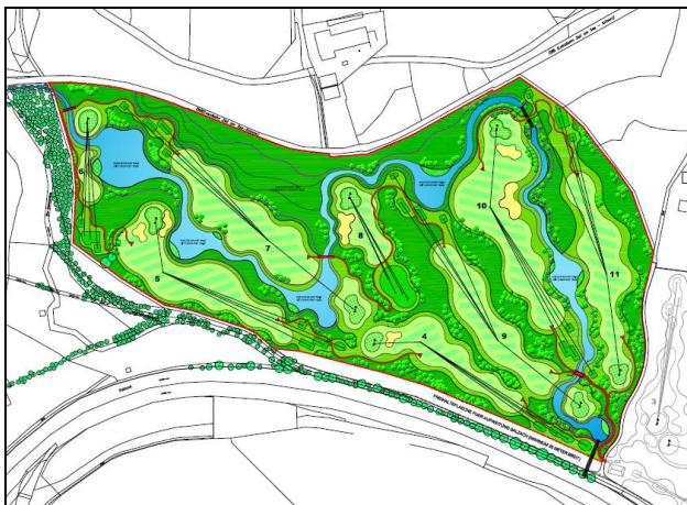
Masterplan der geplanten Erweiterung, HARRADINE Golf, Dubai, United Arab Emirates

Für die geplante Erweiterung des bestehenden Golfplatzes von derzeit 36 auf 42 Löcher (2 x 18 und 1 x 9 Spielbahnen) bedarf es zusätzlicher Grundflächen im Ausmaß von ca. 23 ha. Aufgrund der Größenordnung ist für das Vorhaben eine Umweltverträglichkeitsprüfung erforderlich, wofür es gemäß dem Salzburger Raumordnungsgesetz einer verpflichtenden Umweltprüfung bedarf.